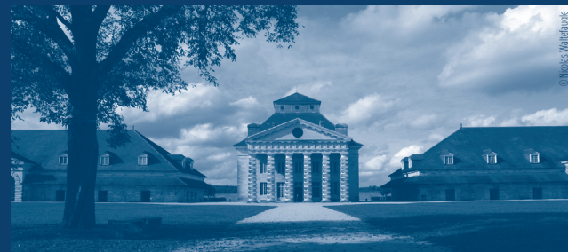
Saline royale d'Arc et Senans

Manufacture royale du dix-huitième siècle destinée à la production de sel, la Saline royale d'Arc et Senans fut conçue par l'architecte Claude Nicolas Ledoux. Classée Patrimoine Mondial par l'UNESCO en 1983, elle est un témoignage unique dans l'histoire de l'architecture industrielle.